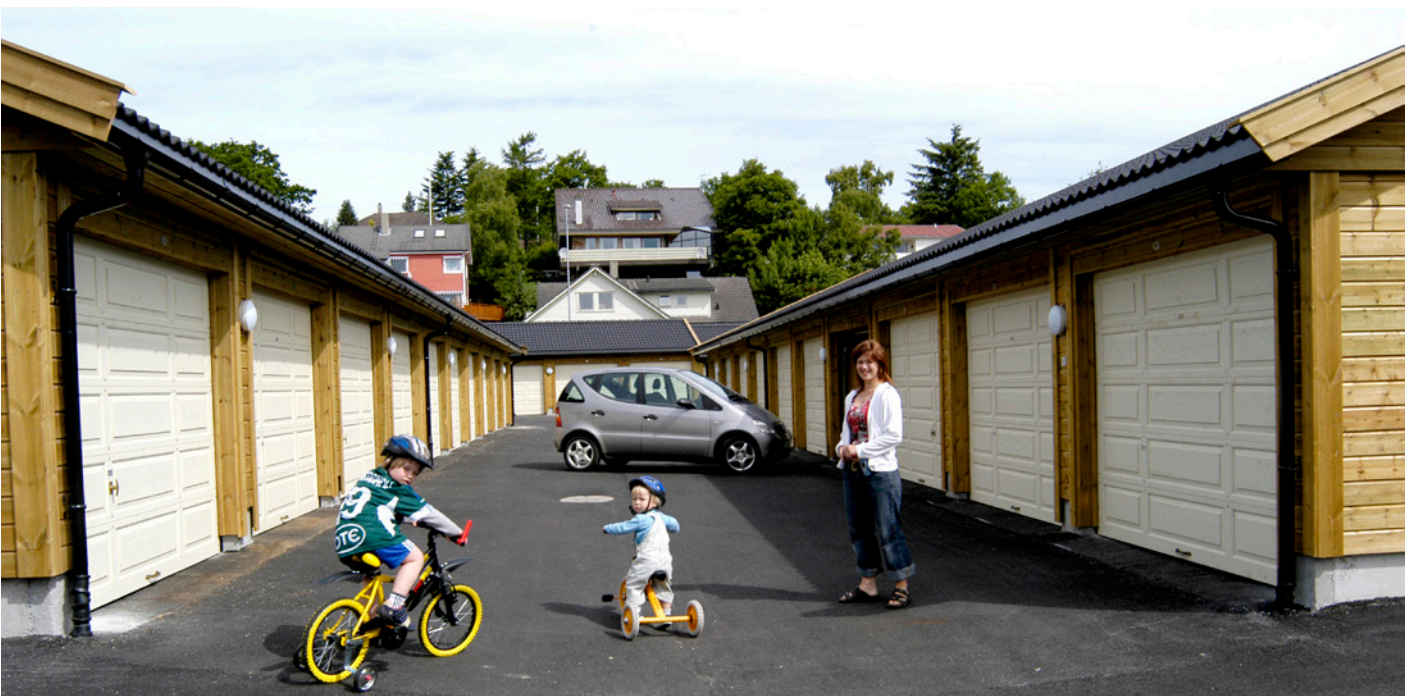
EFFEKTIVT: Igland rekkegarasjer gir høy utnyttelsesgrad på tomten.