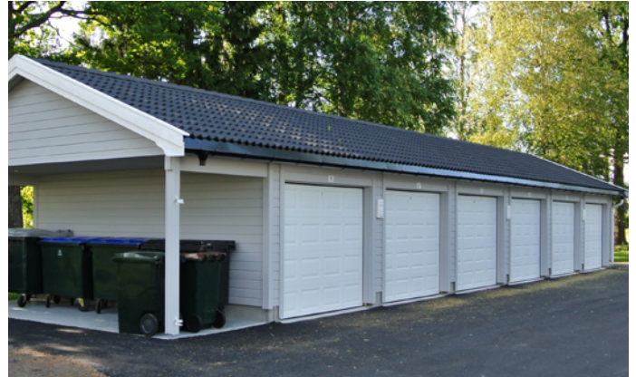
22° TAK: Løsning med garasjer og område for avfallshåndtering under samme tak.