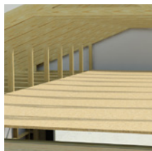
Gulv på loft