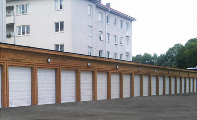
3° TAK: Et lag Mestertekk på tak og god plassutnyttelse med 23 parkeringsrom.

Igland Garasjen er en komplett leverandør av garasjeanlegg - nybygg eller renovering. Vi kan sammen med samarbeidspartnere stå for utførelse av alt fra prosjektering, riving, grunn- og betongarbeid og oppføring av nytt bygg.