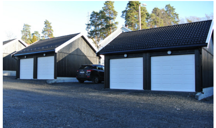
36° TAK: Denne løsningen sikrer god plass på innsiden og utsiden.