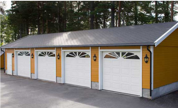
22° TAK: Få unike detaljer på din garasje.